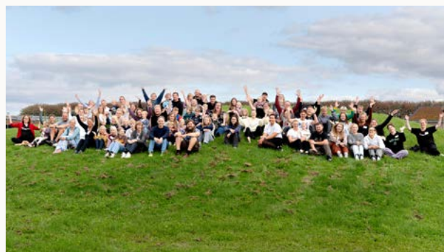
Sammenhold og glædelige stunder på årets Familiekursus