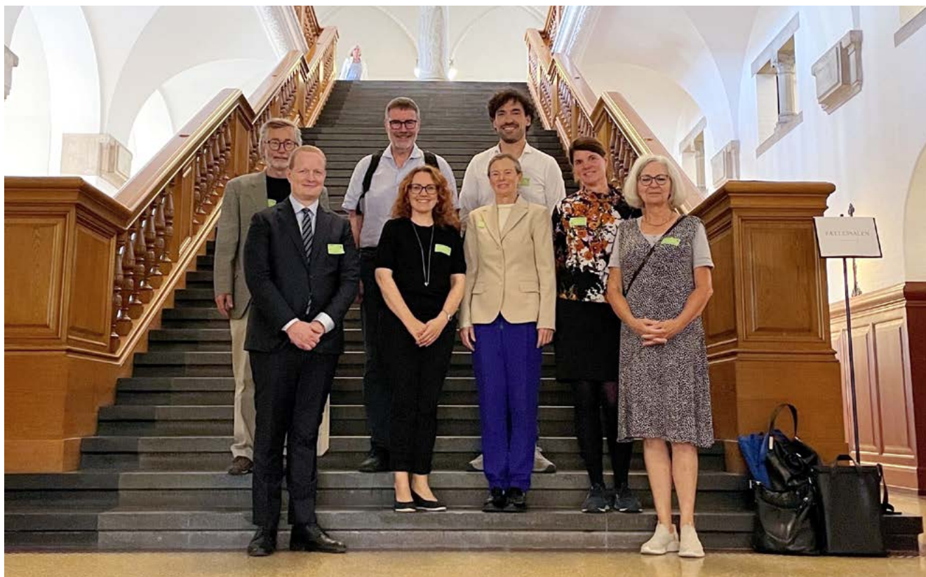
Cystisk Fibrose Foreningen til foretræde i september 2024 for Folketingets Sundhedsudvalg i ønsket om et forbedret undersøgelsestilbud for cystisk fibrose til alle gravide.

Sundhedsstrukturkommissionens ambitiøse og grundige anbefalinger indeholdt mange positive elementer, også for behandlingen af cystisk fibrose. Vi ser ind i en fremtid, hvor flere med cystisk fibrose bliver stadig ældre og også får mere end én behandlingskrævende kronisk sygdom. Som Forening fandt vi det dog bekymrende, at nye initiativer i Sundhedsstrukturkommissionens forslag på sundhedsområdet skulle finansieres ved mindre aktivitet i det specialiserede sundhedsvæsen, som bl.a. varetager behandlingen af cystisk fibrose med de to Cystisk Fibrose Centre på Rigshospitalet og Aarhus Universitetshospital.