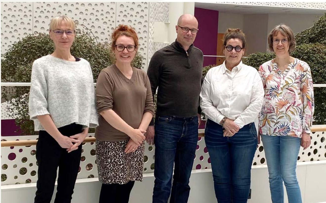
I 2024 var Cystisk Fibrose Foreningen vært for et nordisk videns- og erfaringsudvekslingsmøde med de øvrige cystisk fibrose foreninger fra Sverige, Norge og Finland.

Foreningen arbejder også for, at alle gravide i Danmark tilbydes anlægsbærerundersøgelse for den genfejl, som kan medføre cystisk fibrose hos et kommende barn. Det skyldes, at 3 pct. af befolkning er raske anlægsbærere af cystisk